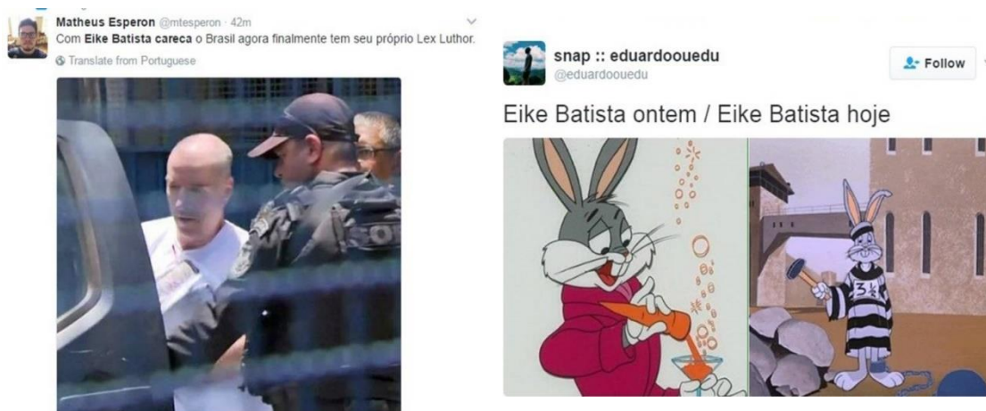
Figura 4 - A vilanização do herói

Outro percurso semântico identificado na análise dos memes diz respeito a desconstrução da imagem do “empreendedor popstar ” (FREIRE FILHO; CASTELLANO, 2012), iniciando um processo de vilanização da imagem do empresário, conforme demonstra a figura a seguir, elaborada a partir de memes vinculados em Vieira (2017).