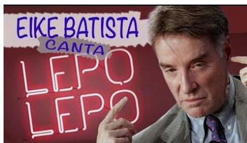
Figura 7 - A “falência” do bilionário como modelo gerencial