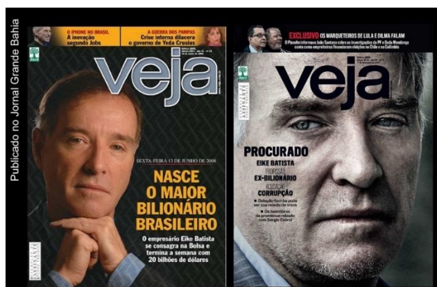
Figura 10 - O papel da mídia na (des)construção do executivo de sucesso

Nesse contexto, é importante destacar que a mesma mídia que atua na construção da imagem de executivo de sucesso e de ícones da (re)produção de estilos de vida pode atuar para desconstruir essa ideia, como evidenciado na figura abaixo.