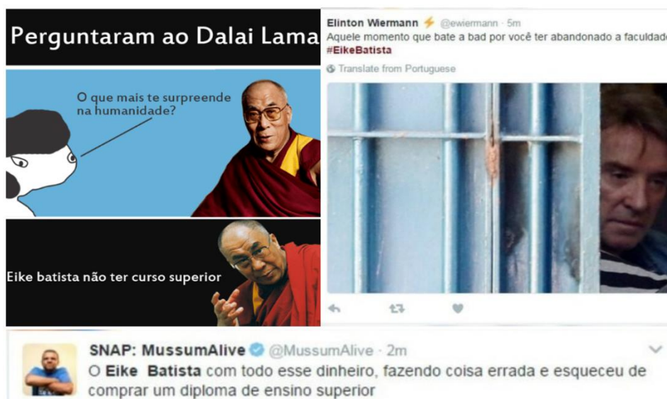
Figura 5 - Escolarização e sucesso gerencial

É importante destacarmos que uma grande quantidade dos memes analisados referiam-se a questão de Eike Batista não possuir ensino superior, fato que se tornou evidente somente no momento de sua prisão, já que, dessa forma, o executivo não poderia usufruir do direito a uma cela especial, tendo que aguardar seu julgamento em cela comum com outros detentos. Tal fato causou estranhamento e surpresa em grande parte da população brasileira, assim como ilustrado pelos memes seguintes, retirados da rede social Twitter .