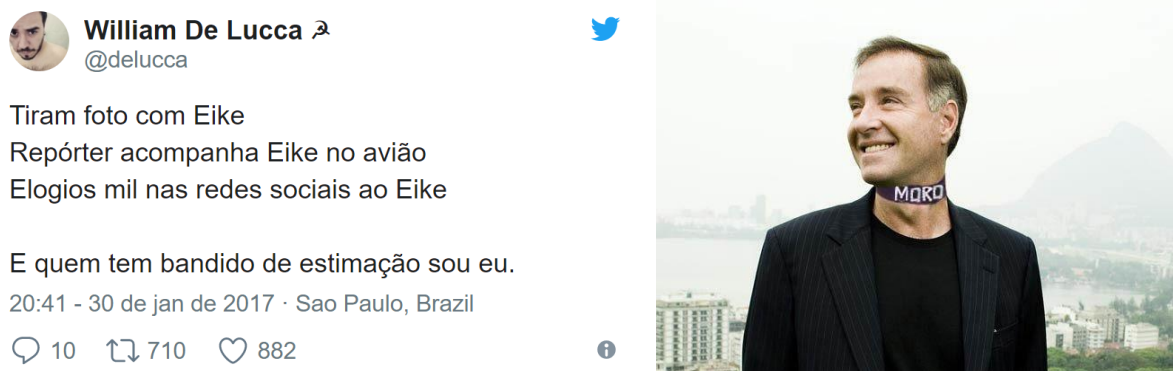
Figura 6 - Interdiscurso da polarização política

Em sequência, é importante ressaltarmos que a utilização dos memes relativos a prisão do Eike Batista traz à tona também o interdiscurso de uma disputa política mais ampla no cenário nacional, isto é, sobre a polarização da população em função de uma disputa partidária entre os considerados de direita e de esquerda, assim como ilustrado pela Figura 6, formada a partir de uma publicação no Twitter e de um meme vinculado em Vieira (2017).