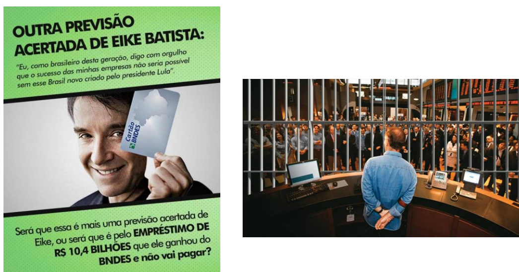
Figura 9 - A continuidade do culto à performance gerencial

O último percurso semântico identificado pela análise do corpus da pesquisa diz respeito a continuidade do culto à performance gerencial, através da eficácia da gestão do personagem. Por meio de sátiras, percebemos que o discurso de diferentes memes reconstrói a imagem do Eike Batista enquanto gestor, entretanto, não mais como um modelo de sucesso a ser seguido, ainda que um deles associe, ironicamente, a imagem do executivo preso à uma oportunidade de empreender novos negócios. O fato é que sua imagem ainda é quase sempre vinculada a elementos que remetem a gestão, conforme identificado pela Figura 9 e por uma sátira retirada da revista Piauí (KAZ; CAPPELLARO, 2017).