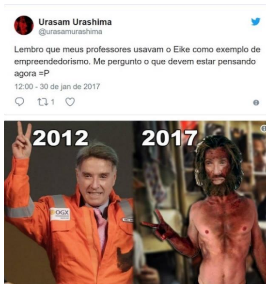
Figura 2 - Eike Batista – um padrão empreendedor?

2007; MURPHY, 2008), disseminando valores e receitas para o sucesso profissional (WOOD JR.; PAULA, 2006) e reproduzindo a ideologia empresarial (SIQUEIRA; FREITAS, 2006).