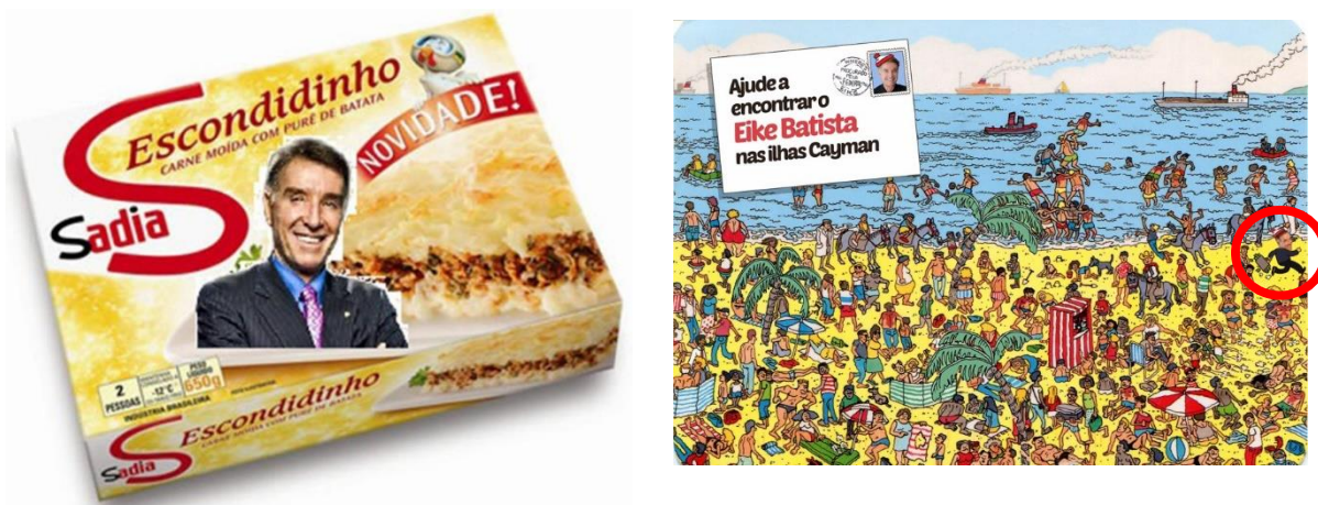
Figura 3 - Onde está o Eike?

O primeiro percurso semântico identificado a partir da análise dos memes refere-se ao Eike Batista enquanto foragido da justiça brasileira. Percebemos esse momento como o prelúdio do processo de desmoralização social da imagem do executivo de sucesso, como demonstrado na Figura 3, elaborada a partir de memes vinculados em Vieira (2017) e Internautas (2017), respectivamente.