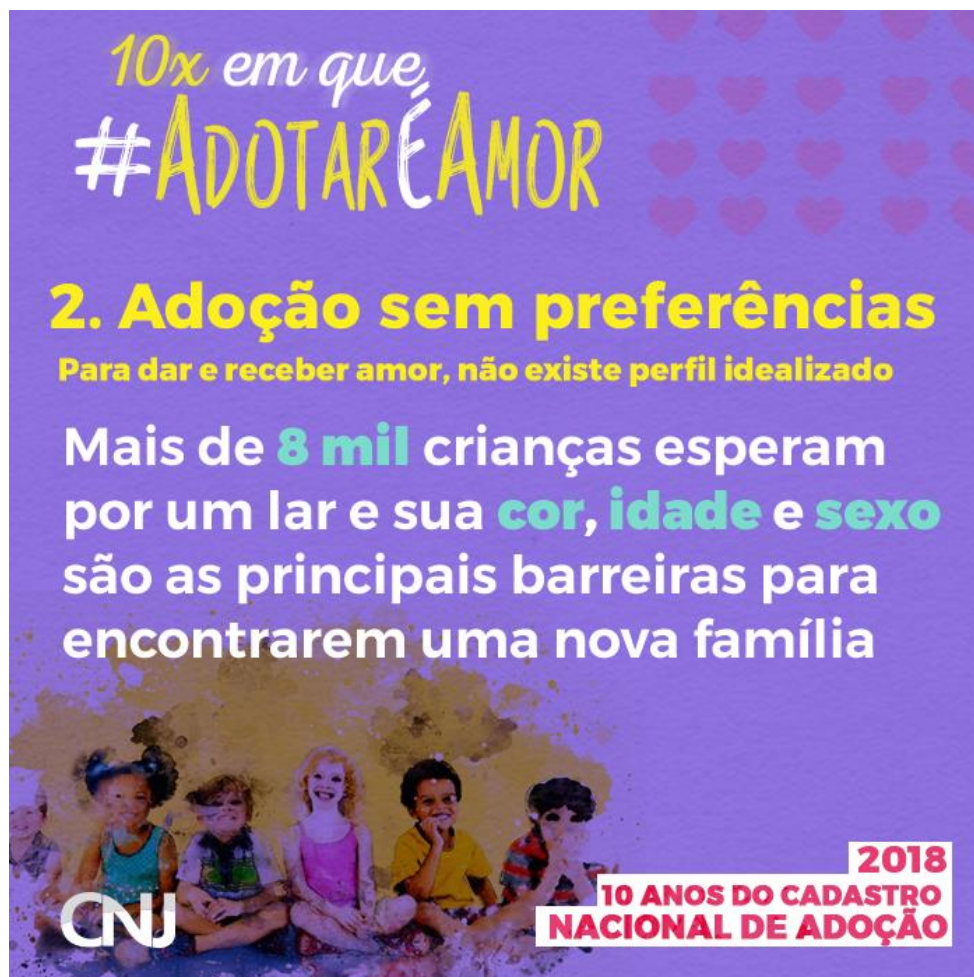
Figura 7 - Imagem publicitária da campanha –#AdotarÉAmor em comemoração dos 10 anos do CNA