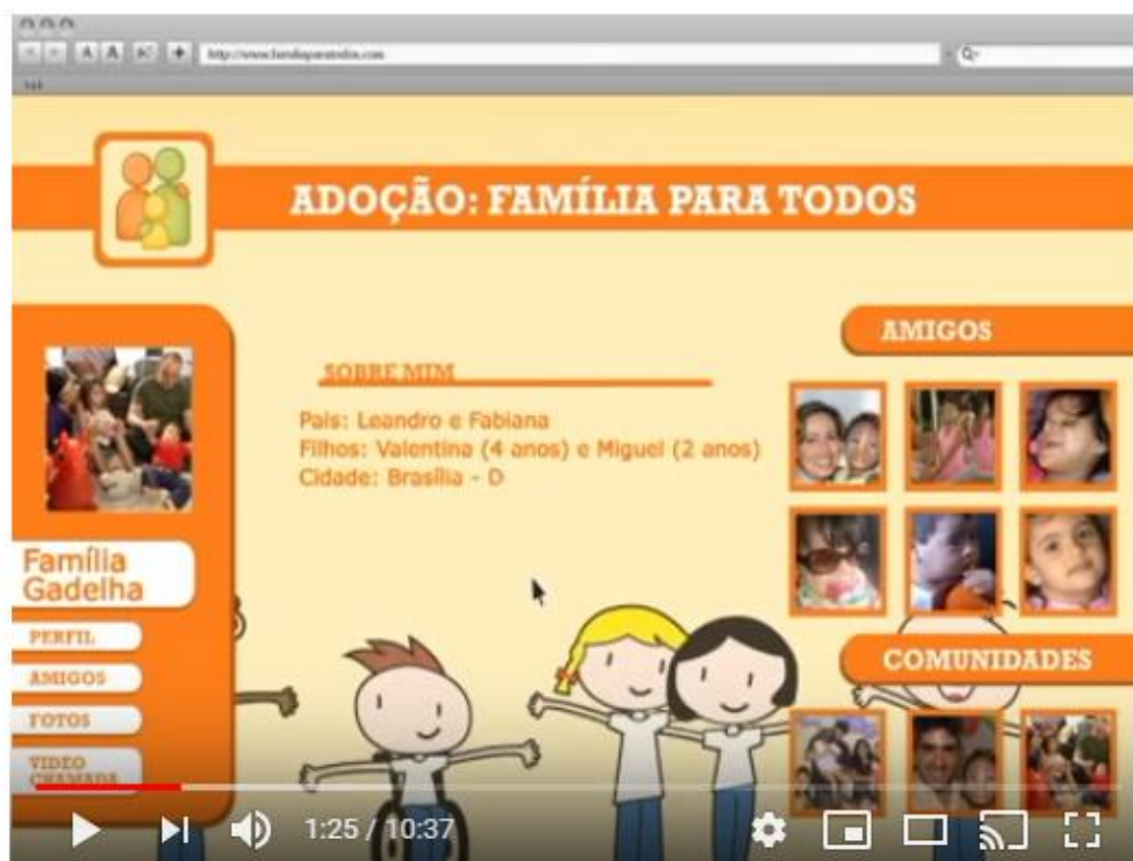
Figura 2 - Vídeo documentário da campanha - Adoção: Família para todos