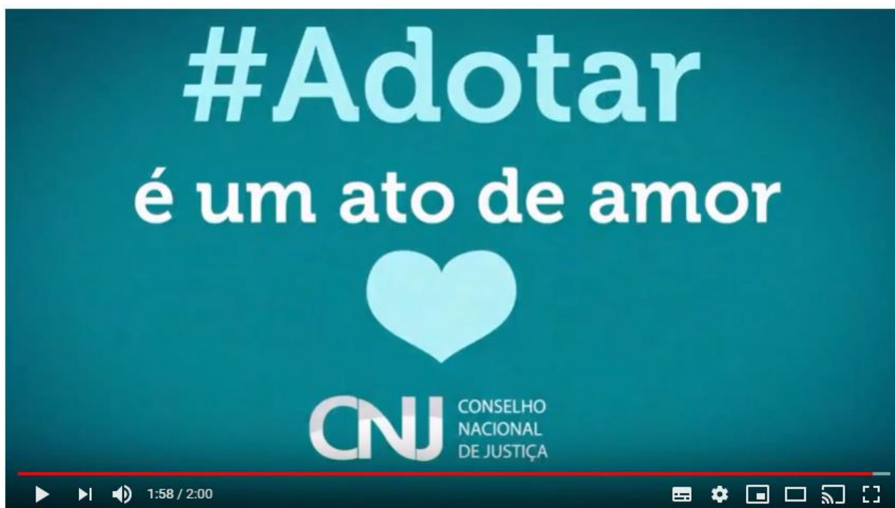
Figura 3 - Vídeo informativo da campanha - #Adotar é uma ato de amor

O vídeo teve caráter informativo, cuja intenção foi a de sensibilizar com narração de histórias reais de pais adotantes e filhos adotivos, além de propor quebrar paradigmas acerca da adoção. Na FIG. 3 apresenta-se uma captura de tela dessa campanha, disponível no site Youtube e no site do CNJ (2015).