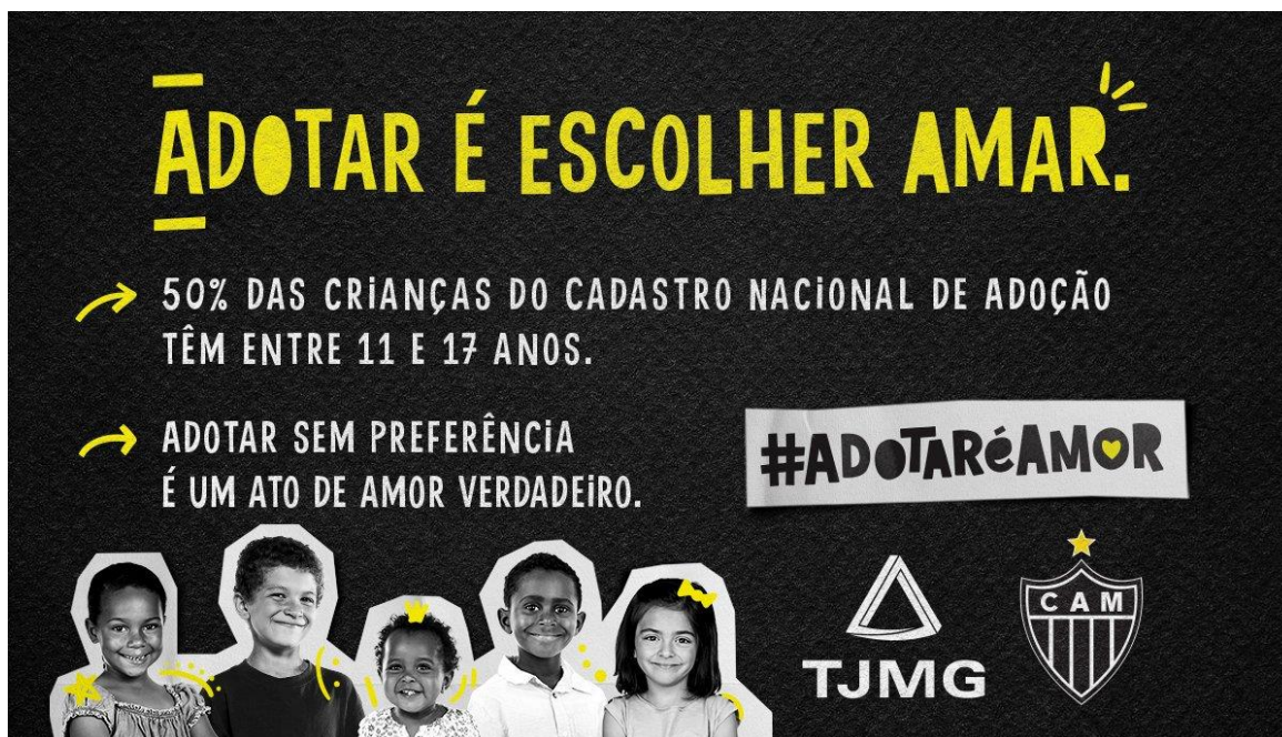
Figura 6 - Imagem publicitária da campanha –#AdotarÉamor

antecederam a data comemorativa dos 10 anos do Cadastro Nacional de Adoção. A FIG. 6 apresenta uma das imagens publicitárias utilizadas na campanha digital.