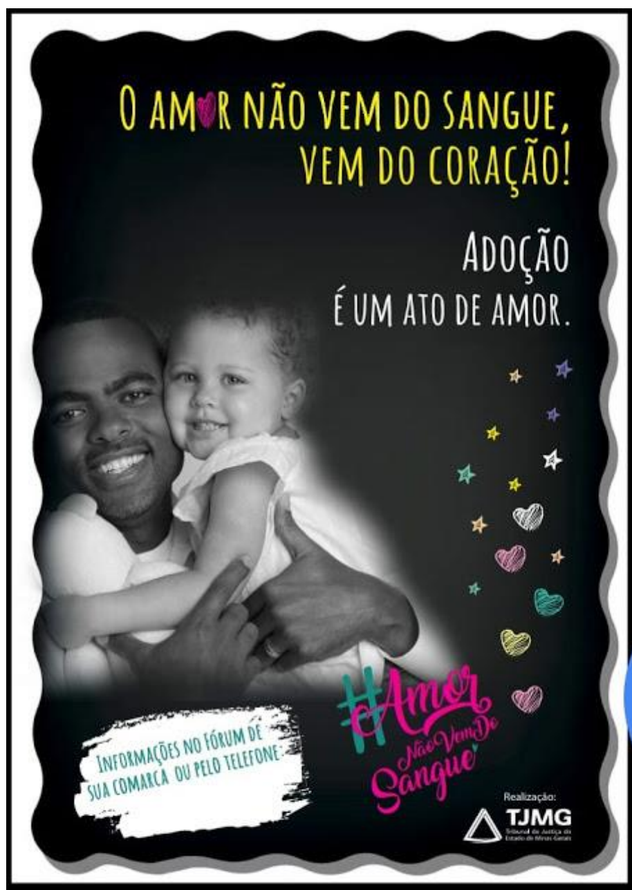
Figura 5 - Peça publicitária da campanha – O amor não vem do sangue. Vem do coração!