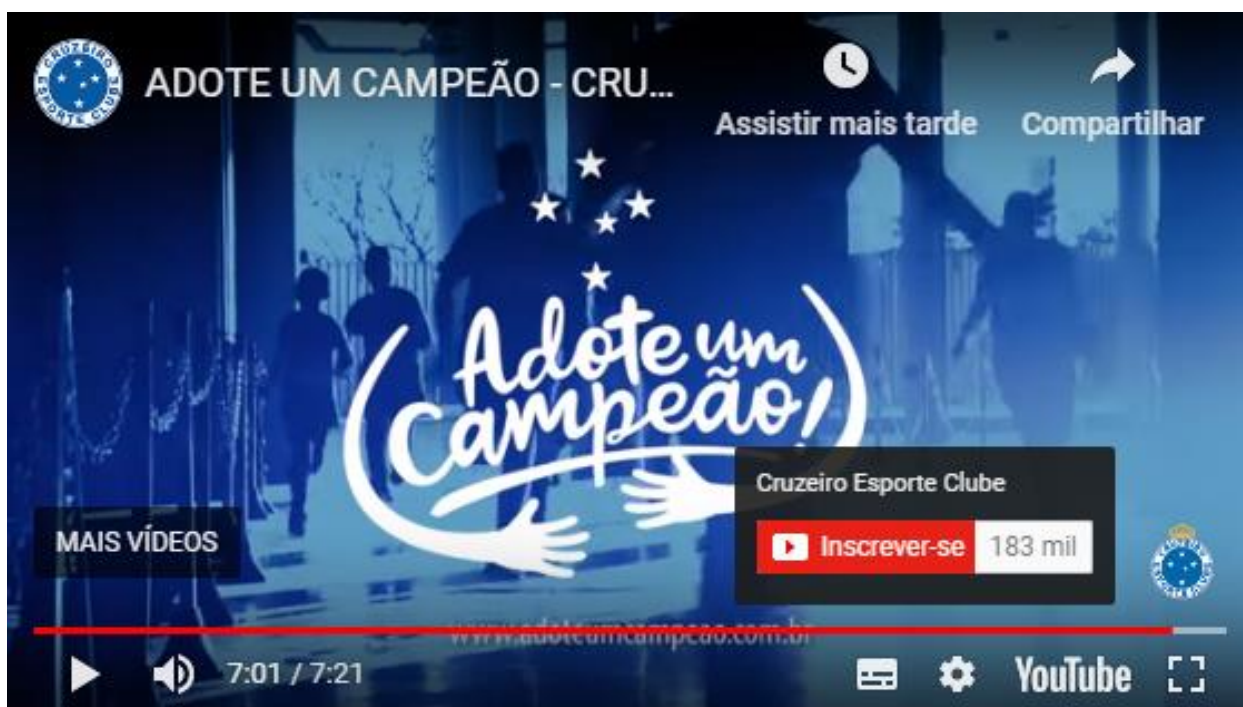
Figura 4 - Vídeo da campanha – Adote um Campeão